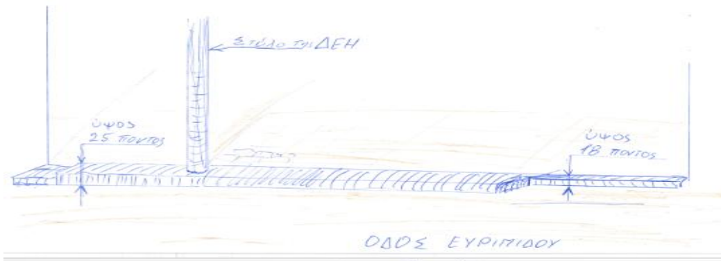
Μπροστινή όψη - Θα γίνει