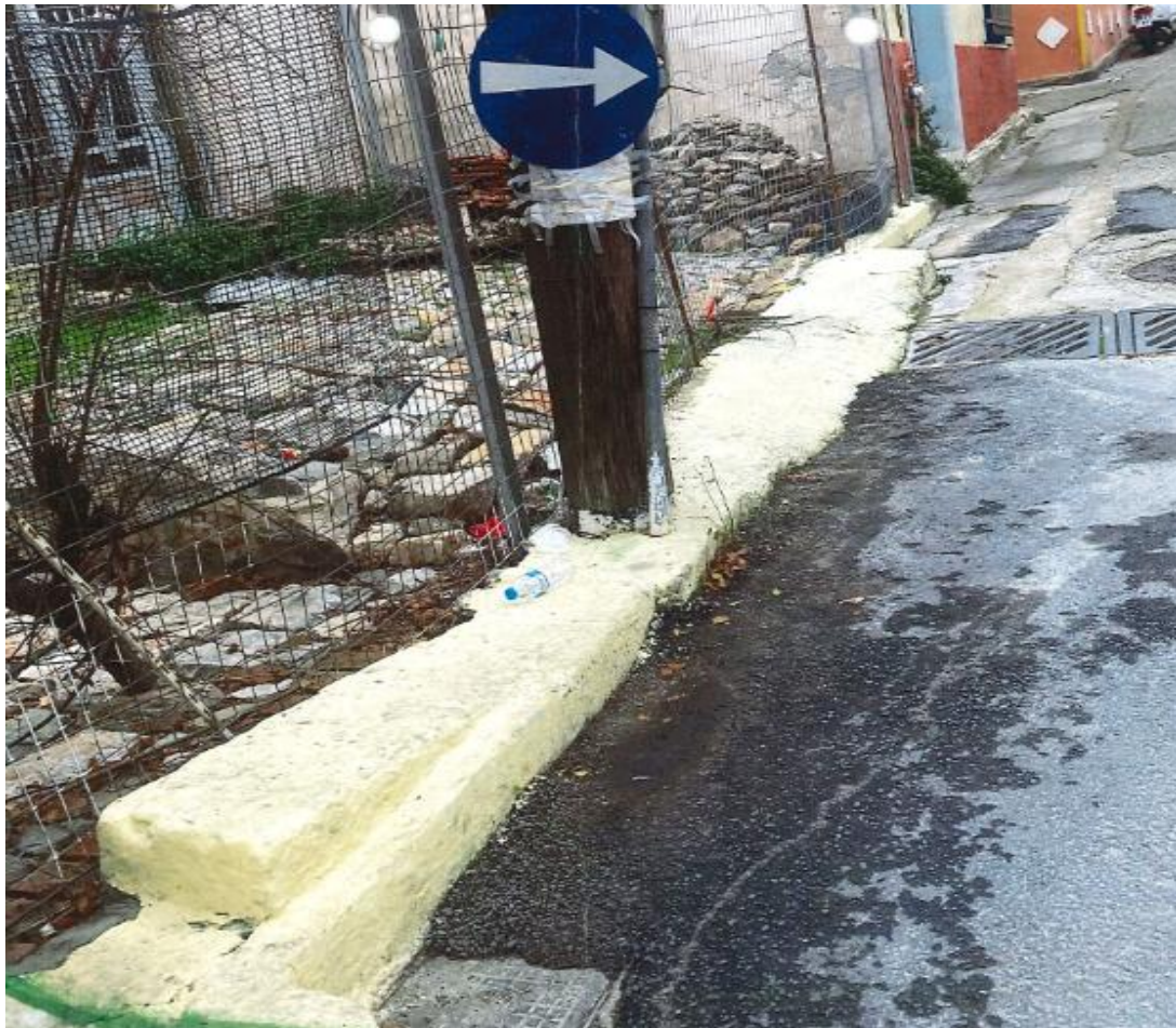
Μπροστινή όψη - Τώρα.