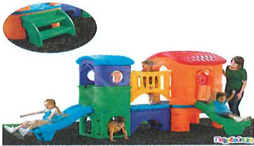
ΠΛΑΣΤΙΚΟ ΣΥΣΤΗΜΑ ΠΑΙΔΙΚΗΣ ΧΑΡΑΣ