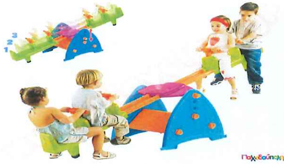
ΤΡΑΜΠΑΛΑ 4 ΑΤΟΜΩΝ