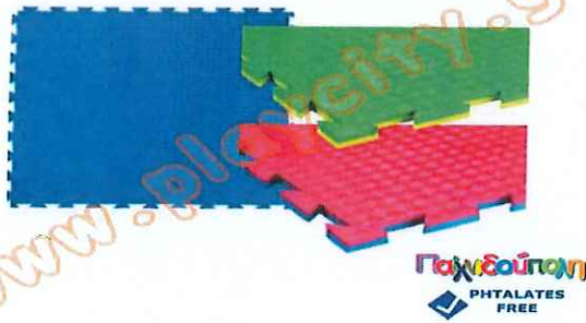
ΔΑΠΕΔΟ ΑΣΦΑΛΕΙΑΣ ΕΣΩΤΕΡΙΚΟΥ ΧΩΡΟΥ